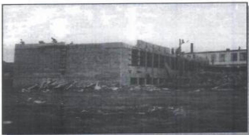
INSA U IZGRADNJI 1950 GODINE

Industrija satova Beograd privatizovana je 14. septembra 2006. godine, a organizovana je kao otvoreno akcionarsko društvo.